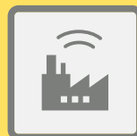
ГУДКИ ПРЕДПРИЯТИЙ И ТРАНСПОРТНЫХ СРЕДСТВ