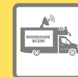
ПОДВИЖНЫЕ ЗВУКОУСИЛИТЕЛЬНЫЕ УСТАНОВКИ